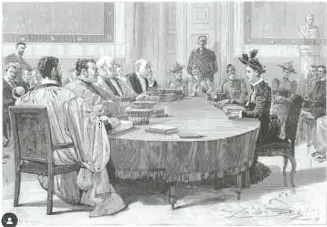
Un grup de oameni într-o sală de recepție dintr-un hotel de la New York în anul 1850.